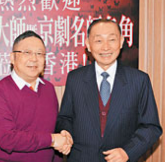
■京劇名師梅葆玖、大師李居明合作愉快。